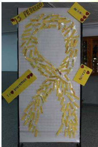
Colegio Don Camilo Hernández